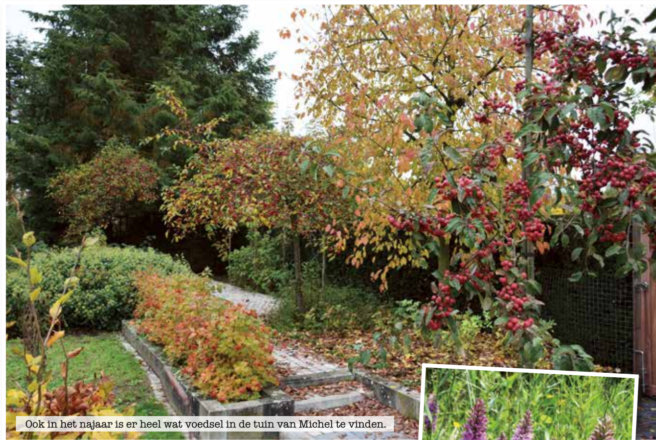
Ook in het najaar is er heel wat voedsel in de tuin van Michel te vinden.

Voor echte hongerlijders voorziet Michel sierappels 'Red Sentinel'. De appels blijven mooi rood tot februari. "Men zegt dat deze appels niet geliefd zijn bij de meeste vogels. Maar door de vorst wordt het zetmeel van de vruchten omgezet tot suikers waardoor ze zoeter worden. Dan kan je de hongerige lijsterachtigen zien smullen. Ook gelderse roos wordt aantrekkelijk. De mooie rode vruchten ruiken en smaken verschrikkelijk maar in echt strenge winters zijn ze het laatste redmiddel voor lijsters en goudvinken."