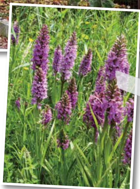
Het paradepaardje van de tuin: de gevlekte orchis.

Het bloemengazon loopt mooi over in de bloemenweide die naar de poel vol amfibieën leidt. Hier ligt ook een orchideeënveld, het paradepaardje van de tuin. "Wilde orchideeën kiezen niet zomaar je tuin uit. De condities moeten goed zijn: je hebt er de zaden en een bepaalde schimmel, mycorrhiza, voor nodig. Die schimmel ben ik gaan uitsteken in een tuin waar de orchissen al mooi bloeiden. Na jaren geduld te oefenen, zag ik eindelijk resultaat: eerst stonden er twee of drie en nu, twintig