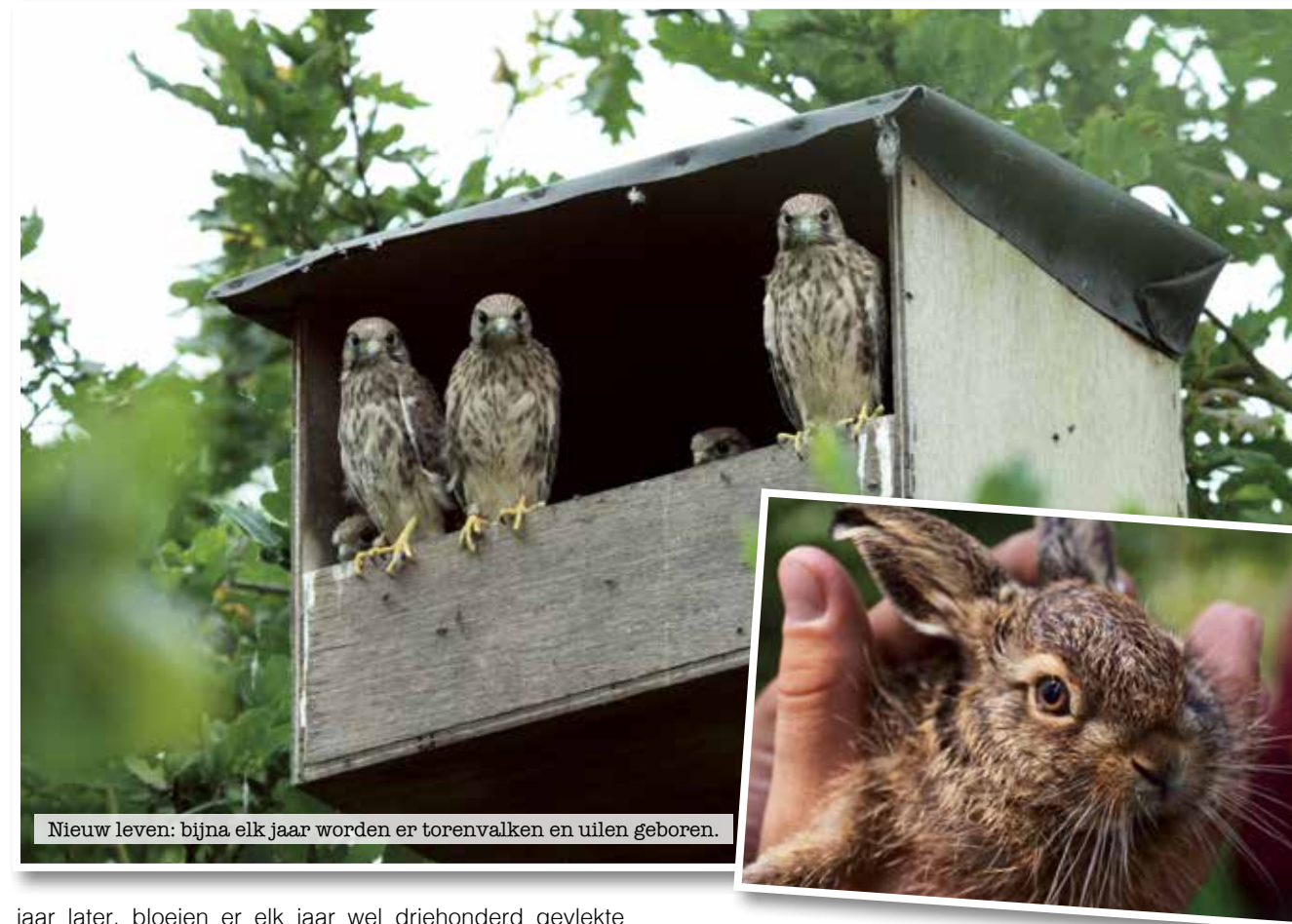
Nieuw leven: bijna elk jaar worden er torenvalken en uilen geboren.

jaar later, bloeien er elk jaar wel driehonderd gevlekte orchissen, rietorchissen en moeraswespenorchissen. En het veld breidt zich nog steeds langzaam uit."