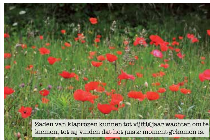
Zaden van klaprozen kunnen tot vijftig jaar wachten om te kiemen, tot zij vinden dat het juiste moment gekomen is.