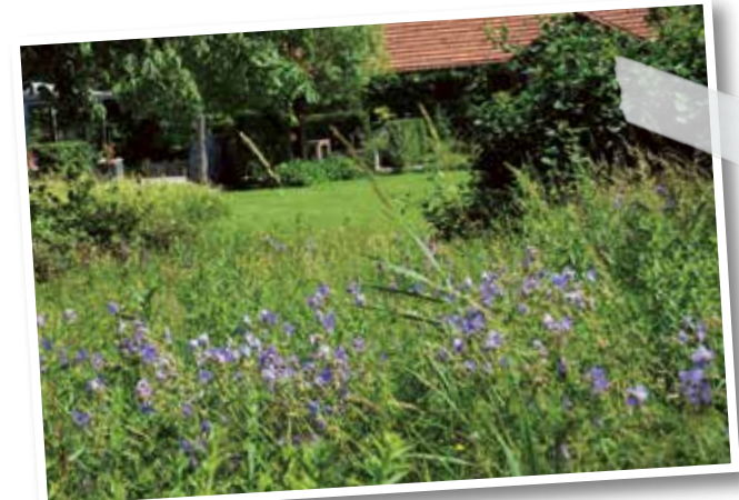
In juni bloeien beemdooievaarsbek, ratelaar en orchideeën rijkelijk.